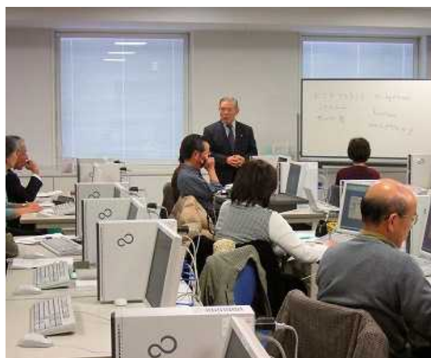
ナルク本部でのホームページ研修会の様子