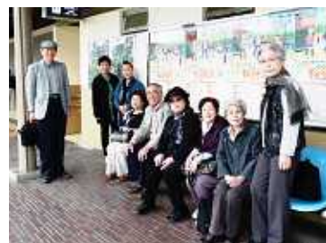
< 阪神芦屋川から、いざ奈良へ >

5月8日、阪神電車芦屋駅に参加者10名が集合、乗り換えなしで近鉄奈良駅まで行ける電車で興味津々で初乗車、1時間で奈良駅に到着です。奈良公園では多くの鹿が私たちを出迎えてくれました。歩くこと約10分で目的地の国立博物館に到着、初めて見る国宝や重要文化財の数々に見入ってしまいました。でもヘッドホンによる音声ガイドのお陰でよく解り楽しく鑑賞することができました。今まで全く知識も興味もなかった私ですが、各時代の歴史や人物を知ることによりちよびり理解できました。奈良時代を象徴する展示品が多く、機会があればまた奈良を訪ねたいと思っています。帰途は周辺の大仏殿、奈良ホテル、ならまち等を散策・観光して楽しい1日を過ごしました。