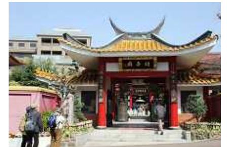
&lt; 中国風の“關帝廟” &gt;