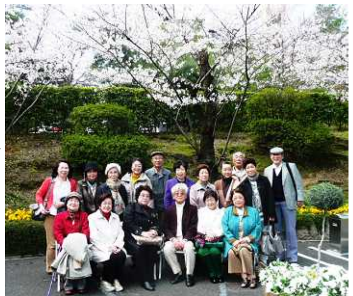
< お花に囲まれる参加者 17名 >

最後は皆さんで「花」を合唱、これもまた上手に二部合唱の綺麗なハーモニーの歌声になりました。毎年この時期になると日本の桜は特別な花であることを感じます。そして様々な出来事があっても必ず毎年桜の花は私達を和ませてくれることに感謝します。