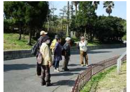
&lt; 大倉山公園の各県ゆかりの森 &gt;