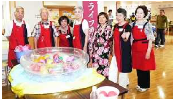
<ゆかた姿のスタッフに迎えられたメンバー>

また、模擬店でのご皆さんは、たこ焼き・焼きそば・おでんなど次から次に、とても美味しそうでしたよ。