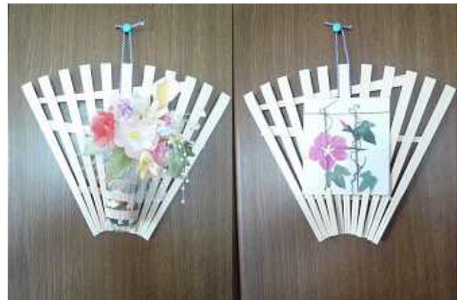
< 一輪の花差し >

8月・9月・10月の手芸は11月バザーを予定していますので 今までの作品創りにご協力をお願いします。