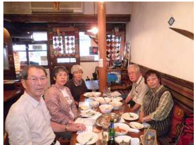
< 雨ぶらのあとトルコ料理店サクルエブへ >