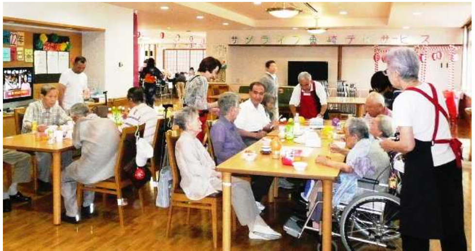
<ごちそうのサービスをするメンバーたち>

口ずさむ人など、とても温かい雰囲気です。午後のひと時を皆さんと一緒に楽しみました。この納涼祭は、ご近所の方々、利用者様のご家族の方など交流会のひとつだそうです。ボランティアとして係わっている私にとっても、いつもと違った係わり方が出来て、とても良い機会になったと思います。