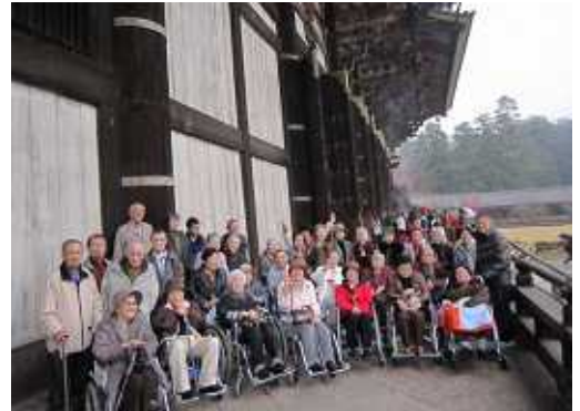
< 大仏様の迫力に感激された皆さん >

楽しい楽しい奈良遠足の思い出は、サンライフで暫く「話の種」になることでしょう。小雨に出会ってしまいましたが、皆さん無事に帰られて何よりでした。同行の施設長さんからナルクにお礼の御言葉を頂き、私たちも楽しい1日でした。