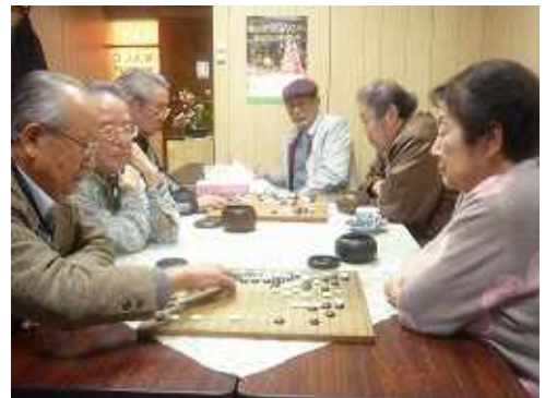
< 熱戦の会員たち >

初めて「同好会囲碁」に参加させていただきました。皆様とも始めてお目にかかる方ばかりでしたが、囲碁の上手な方ばかりで、親切に教えて頂き少しでも上達出来る様、お仲間に入れていただき末長く碁を打っていきたい念願しております。新米の私をどうぞよろしくご指導下さい。次回も楽しみに寄せていただきます。