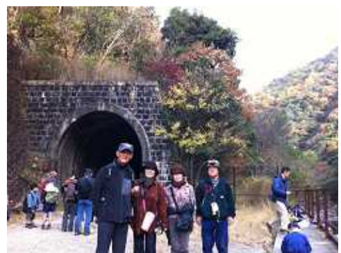
< トンネル入口をバックに記念撮影 >