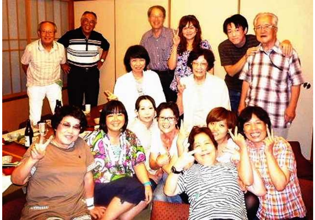
< みなさん和气藹藹で楽しい2時間でした >

ボランティア活動の中ではかわせない話題をお互いに披露し、特に最近加わったスタッフからの趣味の話や、若いと思っていたスタッフが4歳の子供の母親と聞いて驚いた。サンライフからはナルクさんがこられる日は安心して本来の業務に励む事が出来るとの嬉しい言葉があった。ナルク側からは年末のチャリティ・コンサートへの参加の呼びかけや、デイサービスへの「お楽しみサービス」の計画の下打ち合わせ等も行った。お互いに打ちとけ、楽しい約2時間を過ごす事ができた。