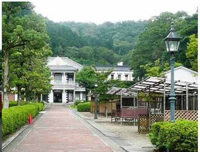
< 多くの価値ある建物が移築保存されている >