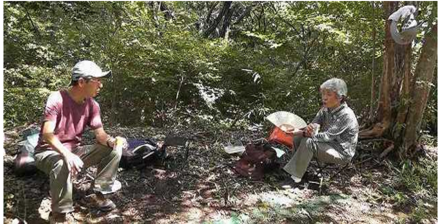
< いぶき公園の森林浴最適コースの途中で小休止 >

森林浴に最適の公園内のハイキングコースを歩いた。30分程歩いて休憩、又歩いて一旦室谷側に出て、更に園内を横断して井吹側のテニスコート上に出て一息いれ、丘を下って公園休憩所で昼食を取る。