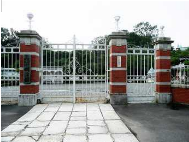
< 明治村の象徴となるゲート >

明治村正門は第八高等学校の正門で、昭和42年に移築された。村内をレトロなバスが運行されており、自由に見学する停留所で乗り降りできる。これだけ数多くの建造物が移築保存されたことに驚く。ゆっくりみれば1日はタップリかかるだろう。