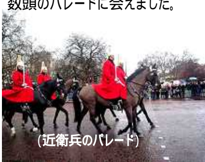
(近衛兵のパレード)