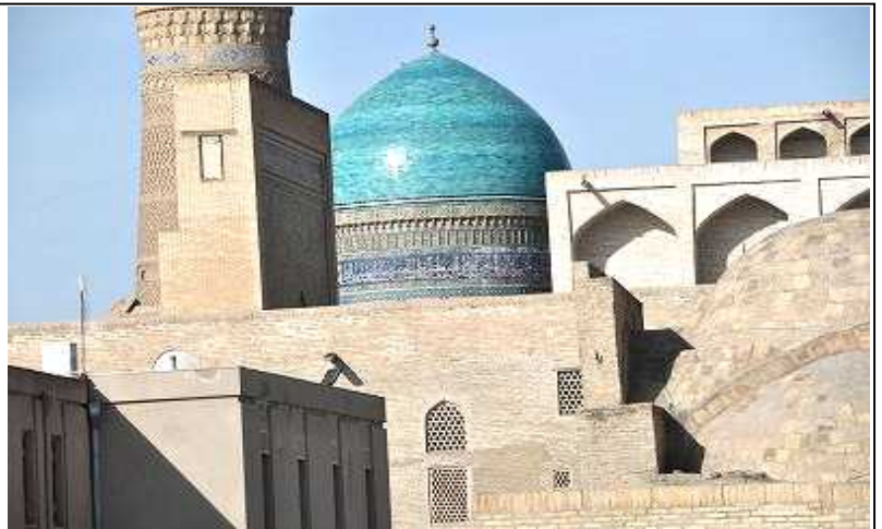
< 砂漠のモスク ウズベクスタン >

現役の頃何も趣味がなかったが、何かやらねばと思って選んで始めたのが写真である。もともと芸術心が無く、私には美を求めるのは無理で、唯写しているだけである。それでも「門前の小僧習わぬ経を読み」で少しは展示会に出せる作品もたまには撮れるようになった。撮影の楽しみは普段気づかぬ対象に出会える事である。先輩に教えられ、その写真を見て眼の付け所、写す技術を学んでいるのが現況である。その他の趣味は語学、エスペラント語である。