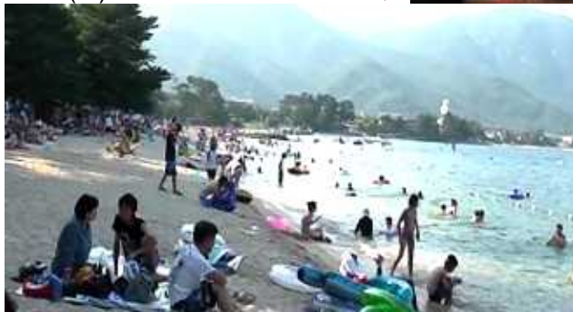
< 日暮れまで大賑わいの舞子浜水泳場 >