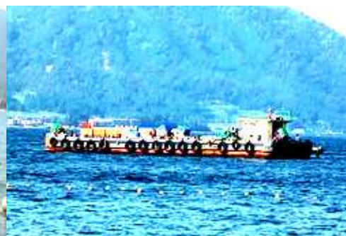
< 沖に花火を打ち上げる台船 >