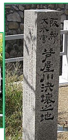
芦屋川決壊之地の碑