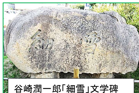
谷崎潤一郎「細雪」文学碑

「蘆屋川や高座川の上流の方で山崩れがあつたらしく、阪急線路の北側の橋のところに押し流されてきた家や、土砂や、岩石や、樹木が後から後からと山のように積み重なってしまったので、流れが其処で堰き止められて、川の兩岸に氾濫したために、堤防の下の道路は濁流が渦を巻いていて、場所に依っては一丈ぐらいの深さに達し、二階から救いを求めている家も沢山あるという」(次号へ続く)