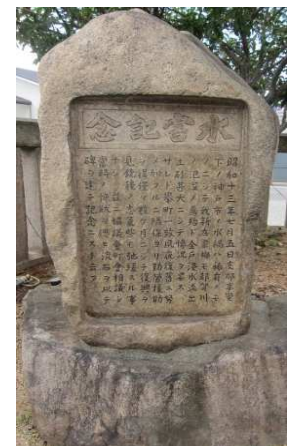
水害記念碑(若宮八幡宮)

この碑文には、都賀川の氾濫のことが刻まれているので、先の慶光寺の「水難慰霊碑」の場合も都賀川の氾濫による水難であったことが想定される。ここまで東から順に、芦屋川、天上川、住吉川、石屋川、都賀川、生田川の決壊・氾濫による惨状が刻み込まれた碑を見、その惨状を目の当たりにする思いがある。さらに西側にある碑を訪ねて行った。