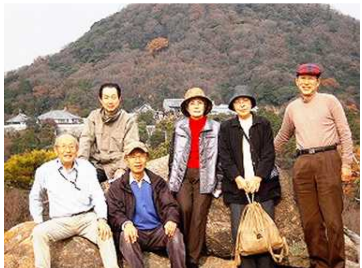
< 背後に甲山・神呪寺を望む展望丘にて >

その後一旦下り、石段を登り神呪寺に到着。21日のしまい弘法で賑わう本堂に参詣する、祈りの鐘を撞く方もいた。そのあと県立西宮森林公園に下り、園内の休憩所で昼食をとる。午後雨が降り出し、鷲林寺行きを中止し、園内の彫刻品を見ながらバス停に出て、阪急の駅まで歩いて下る。駅前の「つまがり」の喫茶でケーキを賞味しながらいつもの団欒を楽しむ。幸い天候に恵まれ寒くもなく良い運動になった。