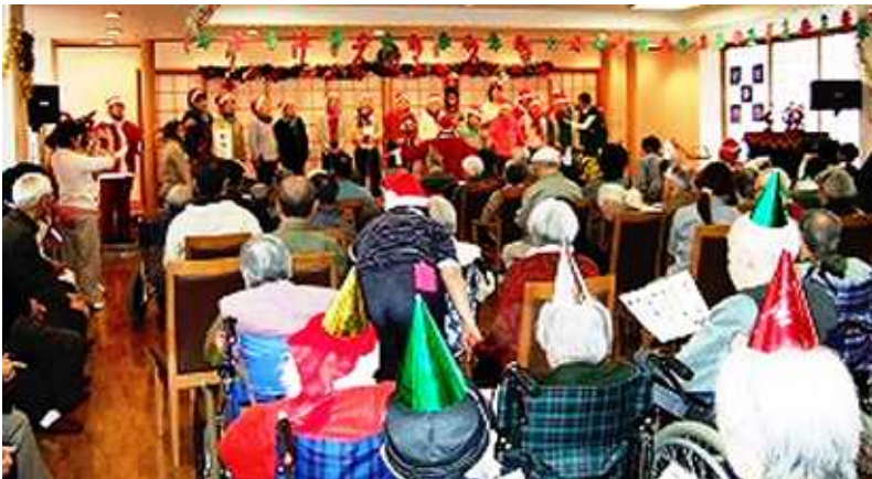
< グループホーム入居者さんの元気な合唱 >

会場いっぱいの皆さん達と楽しませていただき、楽しいクリスマス会のひとときは、盛会のうちに終了しました。