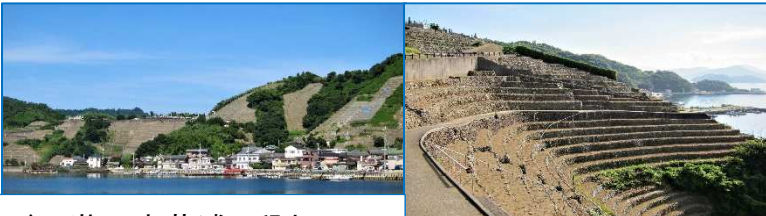
↑ 遊子水荷浦の段畑 →

段畑の開拓は17世紀末頃から始まり19世紀の中頃には斜面のほとんどが段畑になったという。戦後に石垣化の最盛期を迎えたのだという。耕作放棄地が増え、今は一部の段畑でジャガイモが収穫されているという。ジャガイモは水をやらなくて良いそうで(天然水のみで)唯一の農作物らしい。また所どころで甘藷(琉球芋)が栽培されていた。ジャガイモを原料とした焼酎がうまいとのことであったので、一本買い求め、旅の間に賞味した。遊子への入り口にあたる「魚介藻霊供養塔」のある小高い丘の上からの段畑の眺めは、一幅の絵である。(次号へ続く)