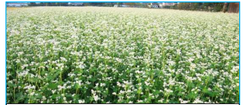
↑松本市内の蕎麦畑の風景

年越しそばは、近所の蕎麦屋さんに蕎麦粉を持ち込み、卵だけをつなぎにした10割蕎麦を打って貰っていた。大きな釜に湯を沸かし、その中に打った蕎麦を入れてざっと湯搔いて、椀に移す。薬味と出汁を入れさらに蕎麦汁を入れて出汁を薄めてから、フーフー言いながら食べる。自然薯を搾り下ろしたものを一緒に入れて食べると一層美味しい。そばを次々と湯搔いていくうちに、釜の中は溶け出した蕎麦の粉でねっとりしてくる。こうなってくると、呑兵衛の出番である。呑兵衛はこれをつまみに酒を飲む。酒を飲む年齢に達していなかったため、その旨さの程は知らない。また、蕎麦の花を見たこともなかった。