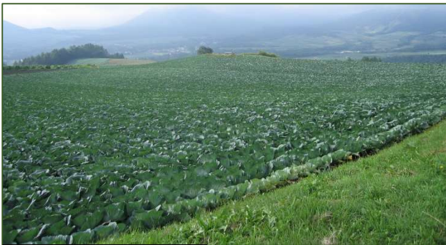
一面のキャベツ畑

嬭恋村を訪れたのは、平成 19 年 9 月 8 日である。定年退職した後、再就職先の会社の勤務地が長野県松本市であったことから、一足早い秋の高原を楽しむ一環で、小布施、志賀高原、横手山、渋峠、草津温泉、嬭恋高原、高峰高原、菅平と巡った時のことである。