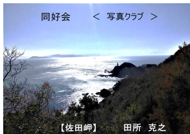
【佐田岬】 田所 克之