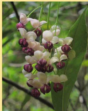
同好会へ写真くらぶ 「アケビの花」 奈島伴治